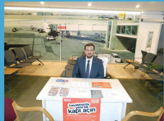
Sivil Havacılık Genel Müdürlüğünde gerçekleştirilen tanıtımda stant açıldı.