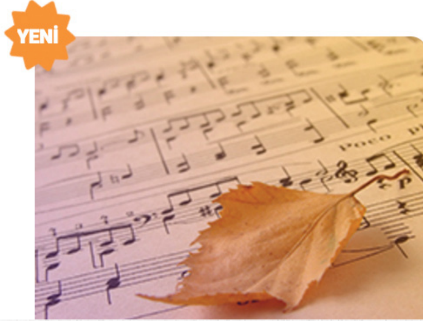
Türk Müziği e-Sertifika Programı

■ Anadolu Üniversitesi'nin zengin altyapısı ve üstün teknolojisi ile Türk Müziği eğitimini büyük kitlelere ulaştırmak amacıyla Türk Müziği e-Sertifika Programı hazırlandı. Programa, Türk Müziği öğrenmeye meraklı en az lise ve dengi okul mezunu herkes başvurabiliyor. Programa kayıtlar, 30 Ocak - 17 Şubat 2017 tarihleri arasında http://esertifika.anadolu.edu.tr/program/30/turk-muzigi-e-sertifika-programi adresinden yapılabilecek.