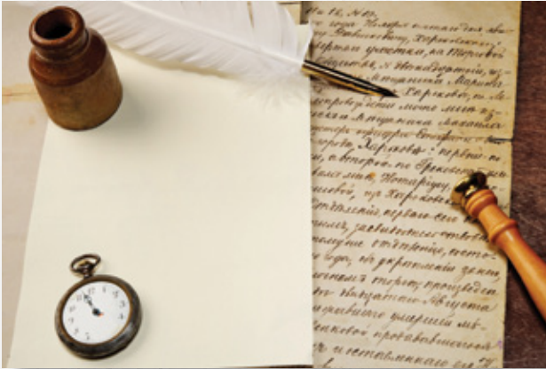
Şiir Okumak ve Yazmak

■ AKADEMA'da, Sosyal Bilimler kategorisi altında “Şiir Okumak ve Yazmak” ve “Aile Yapısı ve İlişkileri” olmak üzere iki ders bulunuyor. 7 Kasım'da kullanıcıların hizmetine açılan her iki ders de sanal sınıflarda yürütülen eşzamanlı oturumlar ile öğretim elemanlarıyla etkileşim kurmaya olanak sağlıyor. Derslere kayıtlar http://akadema.anadolu.edu.tr/cat-sosyal.php adresinden devam ediyor. Katılımcılar kayıt yaptırdıktan sonra, istedikleri zamanlarda https://ekampus.anadolu.edu.tr/ adresinden derslerin içeriklerine ulaşabiliyorlar. Ayrıca, belirtilen ders süreleri boyunca dersin öğretim üyesi ve diğer katılımcılarla iletişime geçilebiliyor. Öğretim üyelerinin verdiği görevleri http://akadema.anadolu.edu.tr adresinde belirtilen süreler dahilinde yerine getiren katılımcılara, dersin sonunda tamamlama belgesi veriliyor.