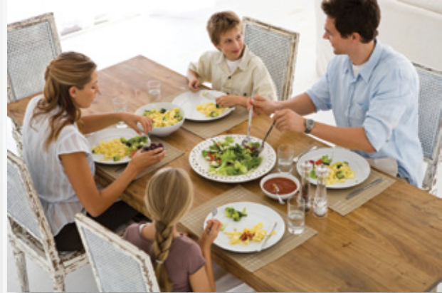
Aile Yapısı ve İlişkileri

“Aile Yapısı ve İlişkileri” dersi Prof.Dr. Sezen Ünlü tarafından yürütülüyor. Bu derste, toplumun en küçük yapı taşını oluşturan aile olgusu ele alınıyor. Ailenin ve evliliğin toplumsal hayattaki önemi, başarılı evliliklerin ortak özellikleri, aile yapısının bozulmasına yol açan etkenler ve sonuçlar ile başarılı anne-baba olmanın altın kuralları üzerinde odaklanılan bu derste, öncelikle okuma ve ders anlatım videolarını inceleniyor, daha sonra ilgili konularda görüş alışverişinde bulunuluyor. 4 hafta süren bu dersin haftalık planı şu şekilde: