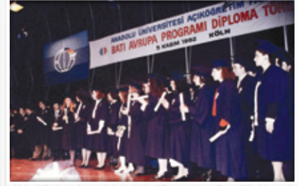
1992 Yılı Batı Avrupa Programı Diploma Töreni

nedenlerle bizim için zordu. Ama Türkiye'de yapamadığım yüksek tahsil imkânı Almanya'da ayağıma gelmişti. Bu fırsatı değerlendirmek istedim. O zaman tek bir fakülte vardı. Açıköğretim Fakültesi İş İdaresi Programına kayıt oldum. Ders kitaplarını işyerinde mola saatlerinde ve akşamları evimde okuyarak ders çalıştım. Haftasonları akademik danışmanlık derslerine katıldım. Türkiye'den gelen hocalarımla güzel hatıralarım var. Evde beni ders çalışırken gören kızımın da, oğlumun da okuma heveslerinin arttığına şahit oldum. Açıköğretim Sistemi bu anlamda gerek bana, gerekse aileme eğitim-öğretim anlamında çok şey kattı. Bizim evin havasını değiştirdi. Eşim dışında evde herkes öğrenciydi. Öyle ki bazen ders çalışmak için kızım ve oğlumla yarışırdık. Üçümüze bir masa yetmiyordu. Dört yıl sonra başarıyla mezun oldum. Bir yıl sonra Köln'de yapılan diploma töreninde benden öğrenciler adına konuşma yapmam istendiğinde çok memnun oldum."