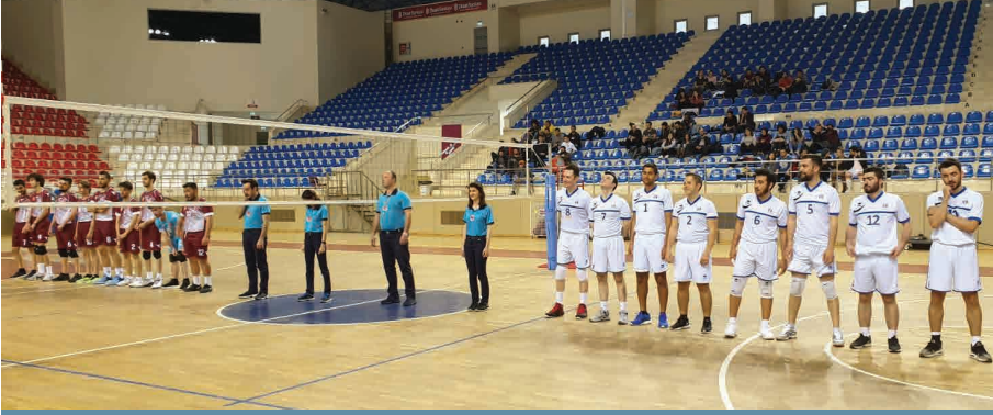
Açıköğretim Erkek Voleybol Takımı

Açıköğretim, İktisat ve İşletme Fakülteleri öğrencileri Anadolu Üniversitesi'nde düzenlenen sportif etkinliklere dört takımla katılıyor. Bu yıl 36'ncısı düzenlenen Geleneksel Bahar Şenlikleri kapsamında oynanan maçlarda Açıköğretim öğrencileri basketbol, voleybol ve futbol dalında kurulan dört takımla yer aldı. Nisan ayında başlayan karşılaşmalarda