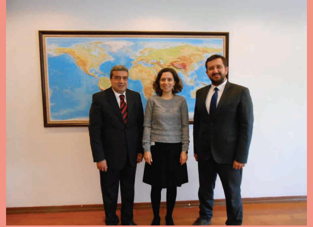
Dışişleri Bakanlığına gerçekleştirilen ziyarette ileride gerçekleştirilebilecek iş birlikleri görüşüldü.