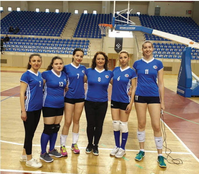
Açıköğretim Kadın Voleybol Takımı

Üç maçı geride bırakan Açıköğretim kadın voleybol takımı 24 Nisan Çarşamba günü Hukuk Fakültesi'yle, iki maçı geride bırakan Açıköğretim erkek voleybol takımı 24 Nisan Çarşamba günü Turizm Fakültesi'yle Eskişehir Teknik Üniversitesi Kapalı Spor Salonu'nda karşılaşacak. Üç maçı geride bırakarak yarı finale çıkma hakkı kazanan Açıköğretim erkek basketbol takımı ise 30 Nisan Salı günü İktisadi ve İdari Bilimler Fakültesi'yle Eskişehir Teknik Üniversitesi Kapalı Spor Salonu'nda karşılaşacak.