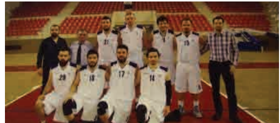
Açıköğretim Erkek Basketbol Takımı