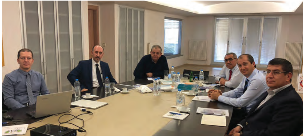
TÜRMOB'da Gerçekleştirilen Toplantıdan Bir Kare

Gerek TESMER'in gerekse Kamu Gözetim Kurumunun meslek mensuplarına uygulamak istediği sürekli ve zorunlu eğitimlerin bir kısmının Açıköğretim Sisteminin e-Sertifika uygulaması ile karşılanabileceğinin belirtildiği toplantıda, muhasebe mesleğinin gelişimi ile Açıköğretim Sisteminden mezun olanların etkileşimini araştırmaya ve geliştirmeye yönelik proje çalışmalarına kurumsal destek sağlanabileceği ve ortak çalışmalar yapılabileceği vurgulandı.