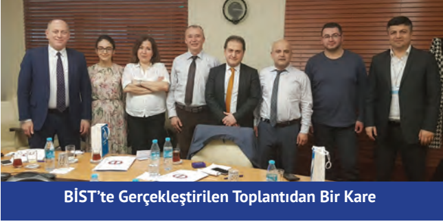
BİST'te Gerçekleştirilen Toplantıdan Bir Kare