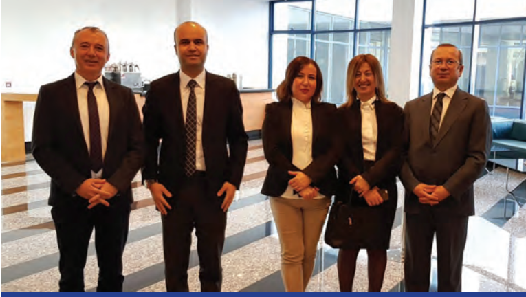
Ekonomi Bakanlığında Gerçekleştirilen Toplantıdan Bir Kare