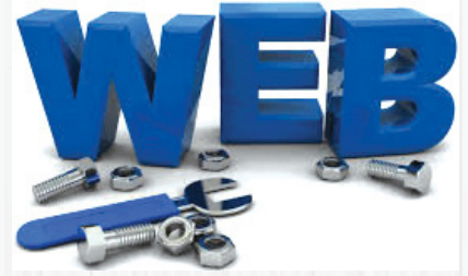
Web Tasarımı ve Kodlama Önlisans Programı

sinin belli bir sistematik yapı içerisinde kurulmuş ve daha çok bireysel hizmet sunumuna ilişkin olması ise seçiciliği arttırmakta, bunun yanı sıra profesyonelliğin geliştirmesine katkı sağlamaktadır. Programlar hakkında detaylı bilgiye www.anadolu.edu.tr/acikogretim/turkiye-programlari adresinden ulaşılabilir.