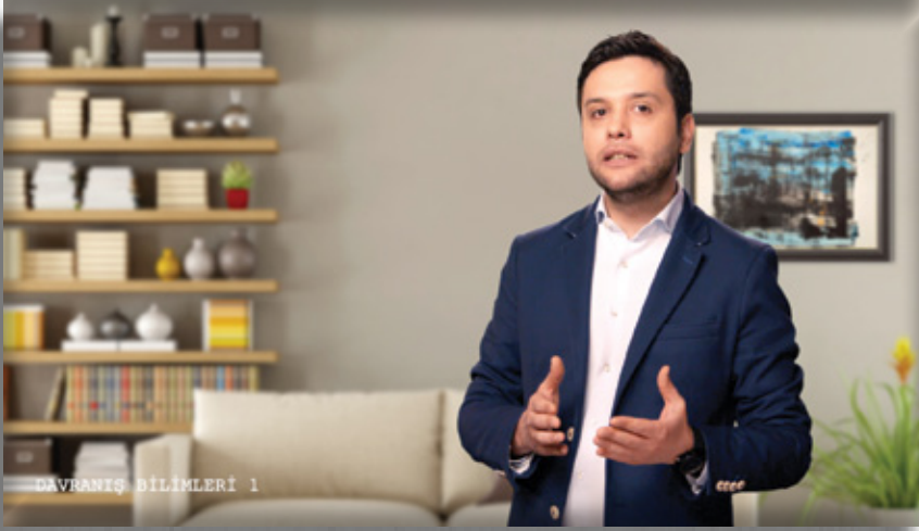
Yeni ders malzemelerinden örnek ekran görüntüsü