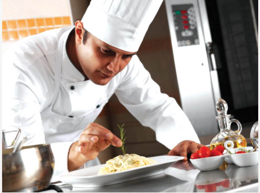
Aşçılık Önlisans Programı